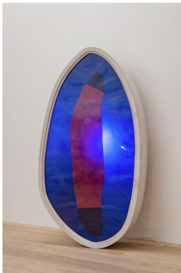
Il n'y a pas de fadeur pour l'amour, 1974, Trois caissons lumineux, rhodoïd © Grégory Copitet - Enseigne des Oudin