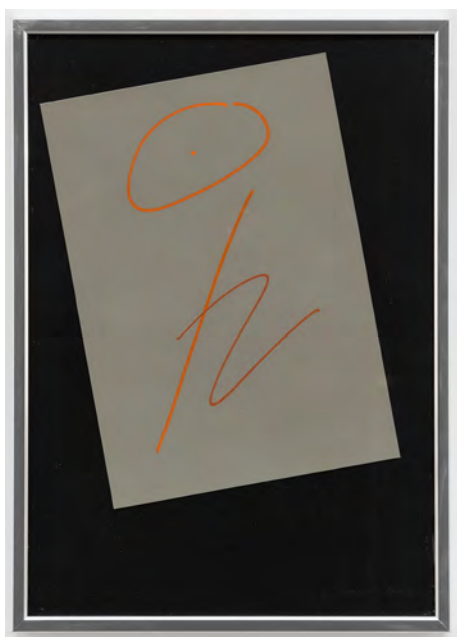
Heidegger - Etre, 2004, Stylo gouache sur papier, (29,7 x 21 cm) © Grégory Copitet - Enseigne des Oudin