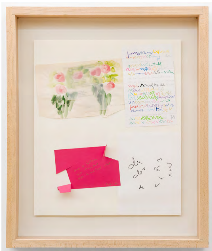
Du doré de chez nous, 2017, Assemblage de papiers collés, (86 x 66 x 8 cm) © Grégory Copitet - Enseigne des Oudin