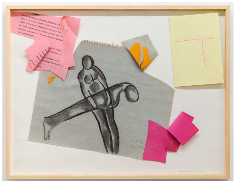
Dragées, 2018 Assemblage de papiers collés non liés, (50 x 65 x 3 cm) © Grégory Copitet - Enseigne des Oudin