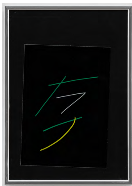
Hegel, 2004, Stylo gouache sur papier, (29,7 x 21 cm) © Grégory Copitet - Enseigne des Oudin