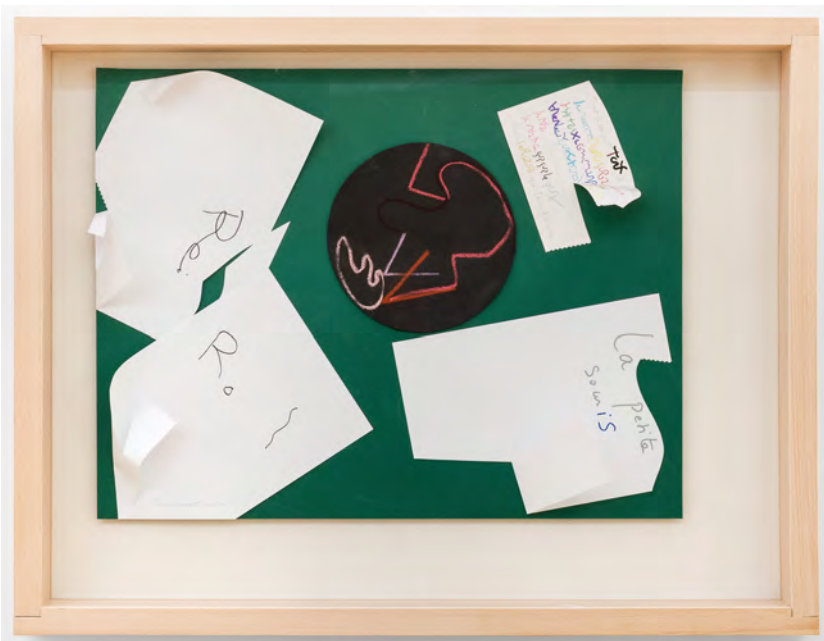
Tout à la nuit tout à la boue, 2017 Assemblage de papiers collés, (86 x 66 x 8 cm) © Grégory Copitet - Enseigne des Oudin