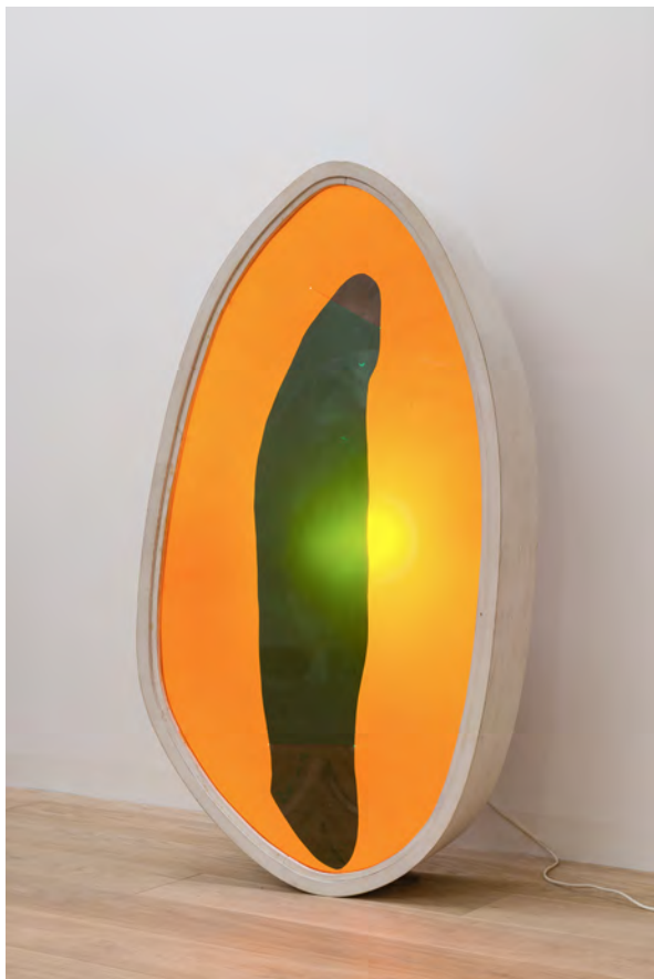
Il n'y a pas de fadeur pour l'amour, 1974, Trois caissons lumineux, rhodoïd © Grégory Copitet - Enseigne des Oudin