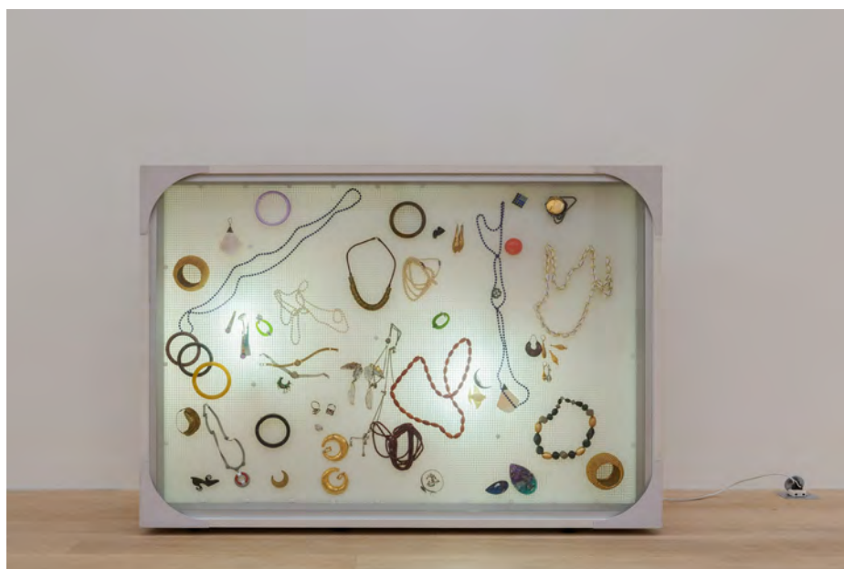
Place aux bijoux aimés, 1976-1991, Caisson lumineux, plan, projet, bijoux