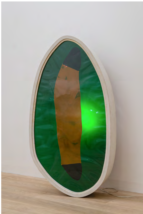
Il n'y a pas de fadeur pour l'amour, 1974, Trois caissons lumineux, rhodoïd © Grégory Copitet - Enseigne des Oudin