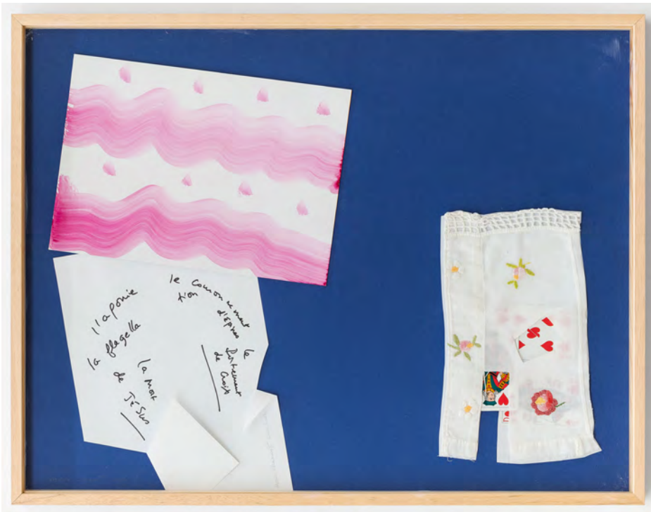
Agonie et couronnement, 2017 Assemblage de papiers collés non liés , (50 x 65 x 3 cm) © Grégory Copitet - Enseigne des Oudin